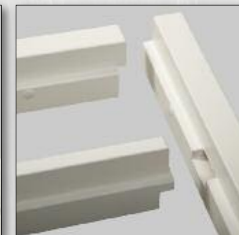
Verbinding bovendorpel / kalf flexi kozijn