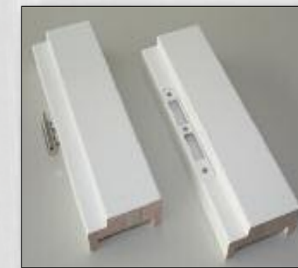
Paumelle en sluitplaat voor opdek kozijn