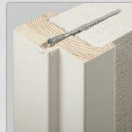
Verbinding d.m.v. nastelbare afstandschroef

agti® smart binnendeurkozijnen zijn eenvoudig te monteren met behulp van pluggen en afstandsschroeven. Het pas- en armschaven van stompe deuren kan fabrieksmatig en is bij de afmontage niet meer nodig, door de nastelmogelijkheden van het kozijn.