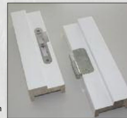
Kogelpaumelle en sluitplaat voor stomp kozijn

Hout is een duurzame, vervangbare grondstof, met een geringe milieubelasting tijdens zowel de productie als de gebruiks- en afvalfase. Door de agti® smart binnendeurkozijnen te lamineren trekt het hout niet meer krom, en is er dus minder afval. Er worden uitsluitend watergedragen verven en lakken toegepast. Kortom, agti® smart past optimaal bij de richtlijnen van duurzaam bouwen.