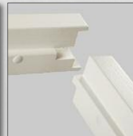
Verbinding bovendorpel normaal kozijn